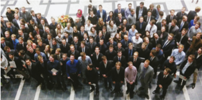
Sie passen kaum in Bild: Die Fakultät für Maschinenbau bringt in jedem Jahr mehrere Hundert Ingenieure hervor, deren Qualifikation sehr gefragt ist.