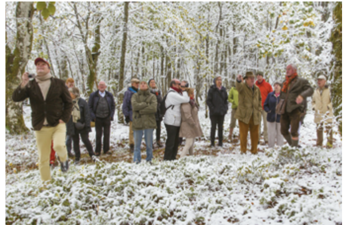
Die Exkursionsgruppe im Krüppelbuchenwald am Hohneck im Elsass im Oktober 2013

Auch Exkursionen, wie sie im Fach Geobotanik nötig sind, werden von der Sektion unterstützt. Dabei gibt es exotische Ziele wie Australien, Japan oder die kanarischen Inseln, aber auch die heimische Vegetation wird unter die Lupe genommen. Mitglieder der Sektion können an diesen