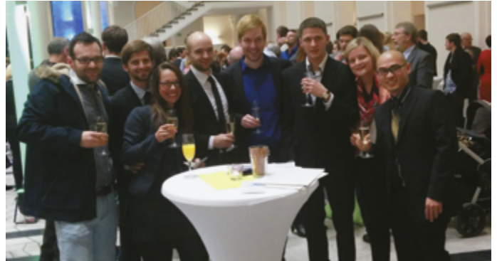
Gut gelaunt in den nächsten Lebensabschnitt.