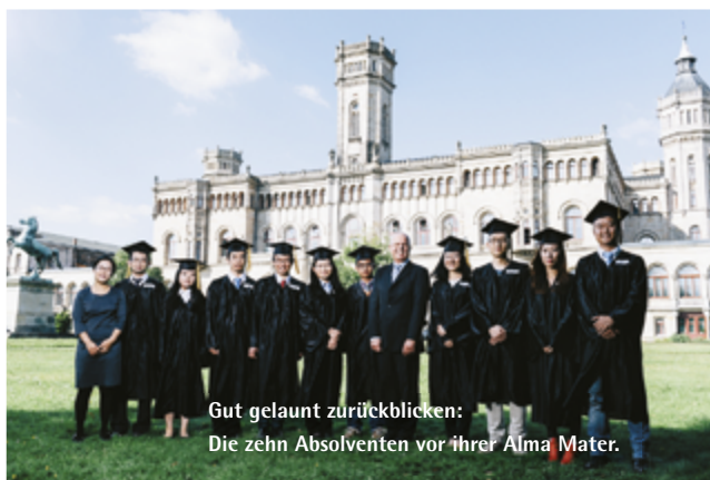
Gut gelaunt zurückblicken: Die zehn Absolventen vor ihrer Alma Mater.