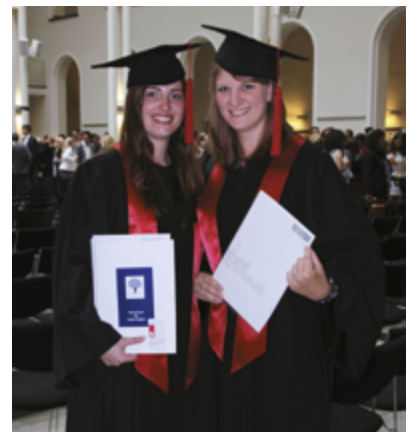
Ganz festlich: Für das Erinnerungsfoto im Talar.

che Ansprache. Die Anwesenden wurden in eine Zeitreise durch die verschiedenen Stationen des Studiums, wie die Preisträger es erlebt hatten, geführt. Neben dem Vergleich der Leibniz Universität Hannover mit Hogwarts und Berichten von Auslandssemestern wurde immer wieder der Vorsatz zitiert, den die Studenten am Ende jeden Semesters hatten: »Nächstes Semester wird alles besser ...«