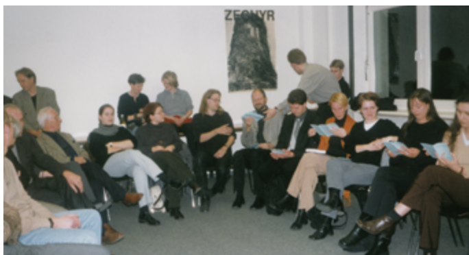
Sehr familiär und persönlich – mit selbstgemachtem Büffet und handgemachter Musik – war 2006 die erste Absolventenfeier des Historischen Seminars.