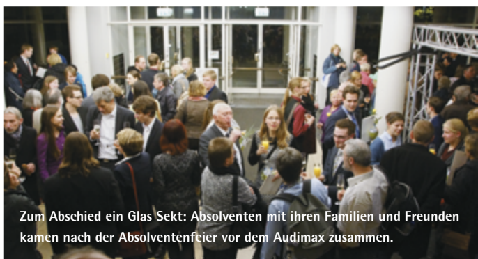
Zum Abschied ein Glas Sekt: Absolventen mit ihren Familien und Freunden kamen nach der Absolventenfeier vor dem Audimax zusammen.

MATHEMATIK- UND PHYSIK-ABSOLVENTEN BEI FRÖHLICHER FEIER FÜR IHRE ABSCHLÜSSE GEEHRT