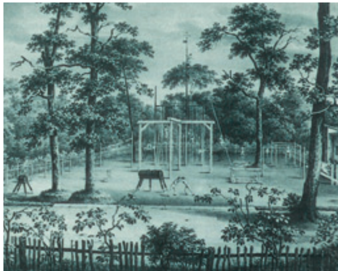
Abbildung 1 Turnplatz auf der Hasenheide in Berlin 1811

das Gegenstück zum sich selbst verwaltenden Sportsystem der damaligen Bundesrepublik, das auf der freiwilligen Mitgliedschaft eines jeden einzelnen im Sportverein beruht. Der Staat (respektive Bund, Länder und Kommunen) leistet hier – nach dem Prinzip der Subsidiarität – allenfalls »Hilfe zur Selbsthilfe«. Im Zuge der friedlichen Revolution von 1989/1990 standen auch für den Sport tiefgreifende Veränderungen an. Am 5. Dezember 1990 lösten sich