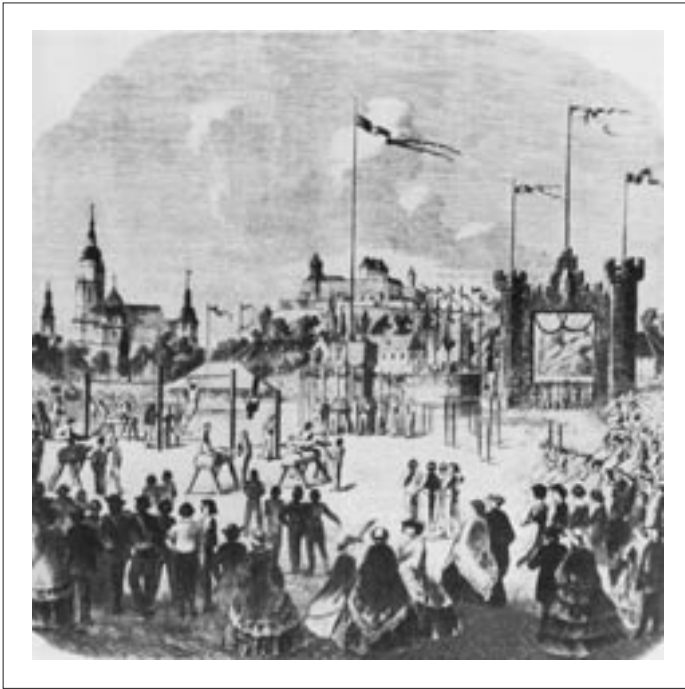
Abbildung 3 Das Coburger Turnfest 1860, nach einer Originalzeichnung von Lehmann

Und wie sieht die »neue« Sportvereinslandschaft in Ostdeutschland heute aus? Inwiefern unterscheidet sich diese von der in Westdeutschland? Kann man im übertragenen