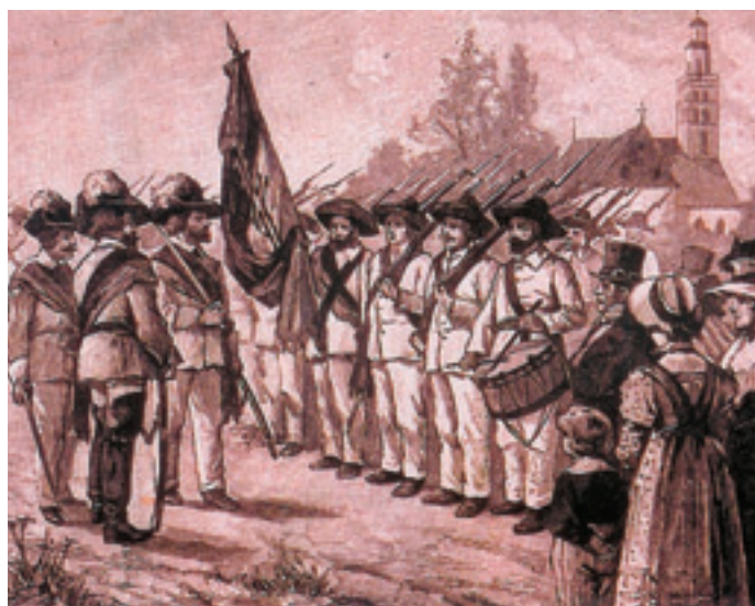
Abbildung 2 Übung der Haunauer Turnwehr 1848

der Politspitze gerecht werdendes Sportsystem unter staatlicher Führung unter anderem mit rein leistungssportlich ausgerichteten Sportclubs etabliert. Dieser Ansatz bildet